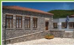
Μουσείο Δημοτικής Εκπαίδευσης